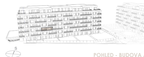
POHLED - BUDOVA A