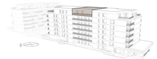
POHLED - BUDOVA A

Poznámka: Vyobrazení bytové jednotky, jejího vybavení (zařízení, nábytku, kuchyňské linky, spotřebičů apod.) a situace území je pouze informativní. Vybavení není součástí dodávky bytové jednotky. Uvedené rozměry jsou pouze orientační a mohou doznat změn. Finální provedení bytové jednotky bude stanoveno dohodou o prodeji bytové jednotky, uzavřenou mezi prodávajícím a kupujícím. Proávající si vyhrazuje právo na změny.