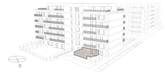
POHLED - BUDOVA B