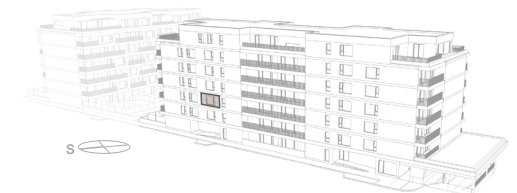
POHLED - BUDOVA A

Poznámka: Vyobrazení bytové jednotky, jejího vybavení (zařízení, nábytku, kuchyňské linky, spotřebičů apod.) a situace území je pouze informativní. Vybavení není součástí dodávky bytové jednotky. Uvedené rozměry jsou pouze orientační a mohou doznat změn. Finální provedení bytové jednotky bude stanoveno dohodou o prodeji bytové jednotky, uzavřenou mezi prodávajícím a kupujícím. Proávající si vyhrazuje právo na změny.