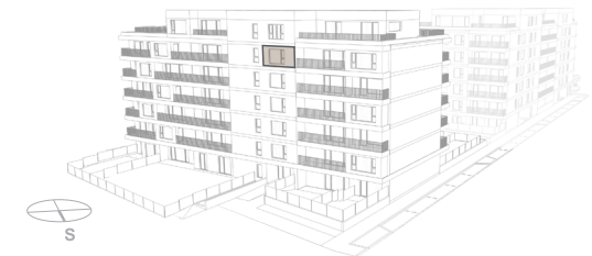
POHLED - BUDOVA B